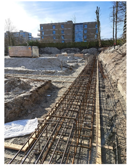
foto van de funderingswapening