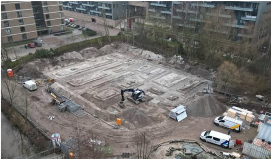
Hierboven een luchtfoto van de bouwput die net ontgraven is